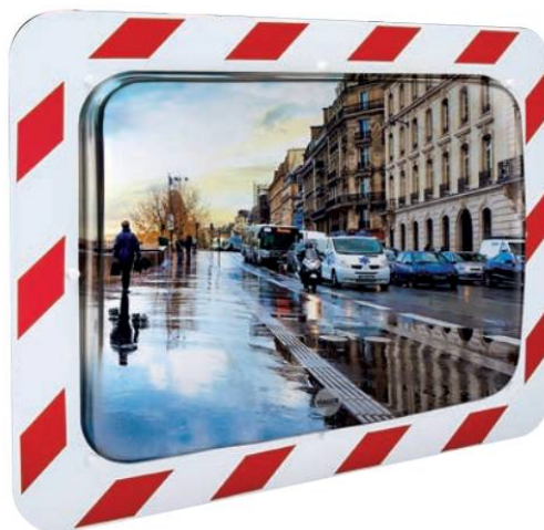
■ Ref. 854 AB

Příslušenství: sloupky jsou k dispozici pro všechny modely.