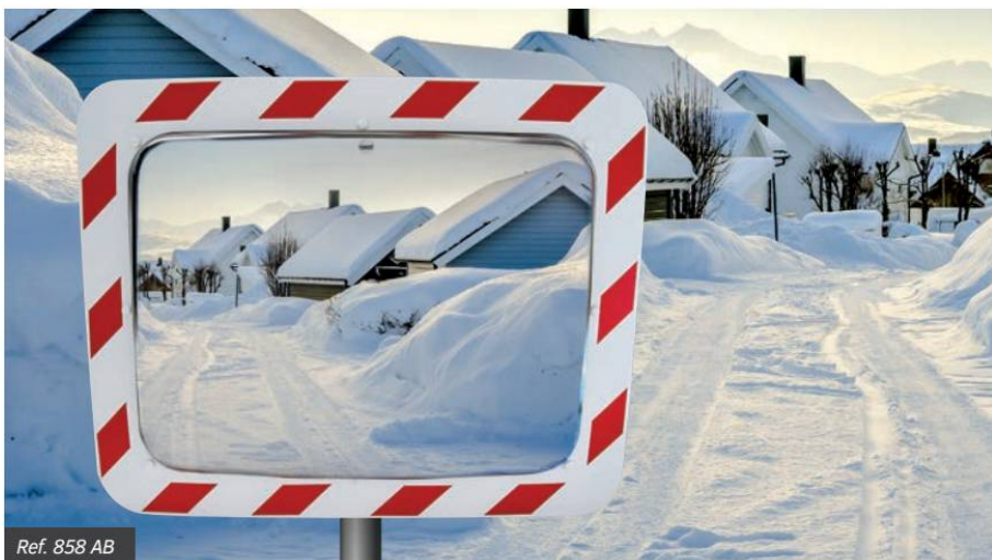
Ref. 858 AB

Protizamlžovací funkce zrcadla VIALUX® zabraňuje tvoření zamlžení při jakýchkoli teplotách a jakékoli vlhkosti vzduchu na místě instalace zrcadla. Ochrana proti námraze VIALUX® je funkční až do teploty -20°C. Zrcadlo využívá teplo nashromážděné během dne a zabraňuje tak vytvoření námrazy.