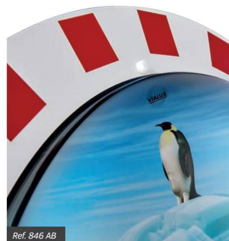
Ref. 846 AB